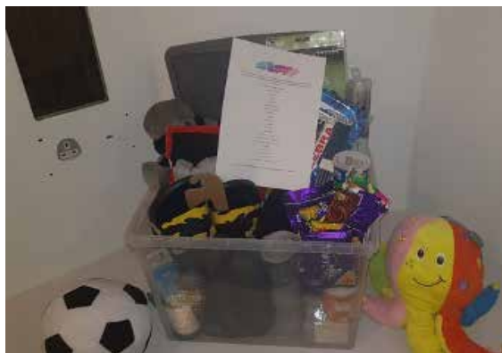
An seomra iontrála nua agus na pacáí iontrála atá deartha ag na daoine óga